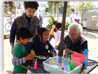
ハッピーデーの様子です

待ちに待った年長組！！大きく期待する気持ちやうれしい気持ちを身体いっぱいに出しながら、園での活動に取り組む子どもたち。ぶどう組だけの活動（リーダー活動、セカンドステップ、ハッピーデー、食育活動）に励んでいます。年下の友達のお世話を通して、優しく関わる気持ちや年長組の意識が芽生えてきています。