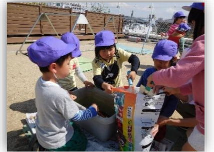
トマトの苗を植えました