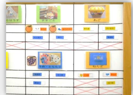
年齢に合った遊びを設置しています