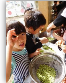
豆の皮、むけたよー！