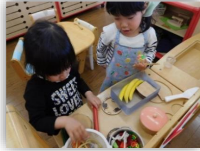
もうすぐで、ご飯できますよ～