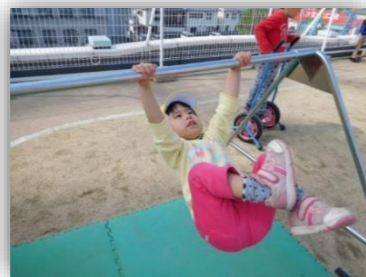
足抜き回りに挑戦！！