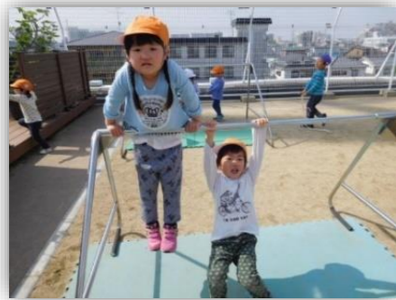
鉄棒って楽しいー

遊びも生活も新しいことがいっぱい、目を輝かせている子どもたち。新しい玩具や遊びに興味津々で、自分の好きな遊びや楽しめる遊びを探しながら、少しずつ見つけ始めています。優しいぶどう組のお兄さん、お姉さんにも助けてもらいながら、安心して過ごしていますよ。