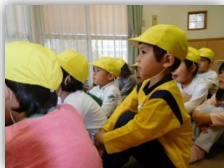
おにいさんの顔になってきました

進級し、また一つお兄さんお姉さんの顔つきになった子どもたち。ばなな組になると遊べる玩具を友達と一緒に遊び、楽しい気持ちを共有し、縄跳びの練習にも毎朝、励んでいます。自分の力でできることも増え、日々の活動に自信を持って取り組む姿がみられますよ。