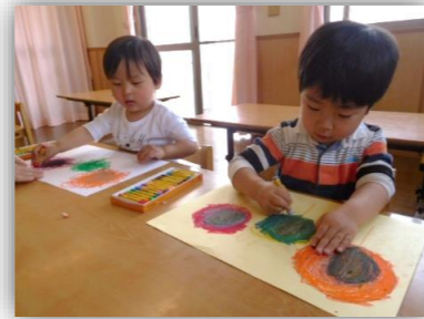
絵画活動の様子です