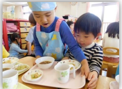
給食はこんできたよ！