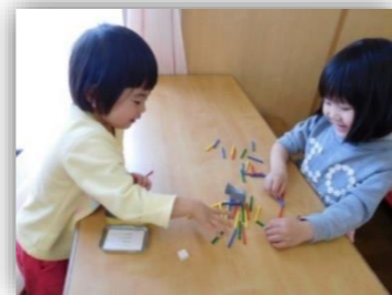
縄跳び、がんばるぞー